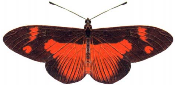
属名 Bematistes 種小名 epaea 英名 Variable Wanderer 和名 ヘンシンホソチョウ 分布 ガンビア、エチオピア、アゴンダ、アンゴラ 開長 66mm

アフリカを中心にインド・オーストラリア区に分布する。大部分の種は深紅に彩られているが死後はあせる。鳥に有毒と思われ相互に擬態し他科に擬態される。これをミュラー型擬態という。ただし、上記のものは、系統的に近縁のグループ内で見られるものでいずれがモデルで擬態者であるのか明らかでないこともあり、これを〈擬態〉と呼ぶべきかどうかについて疑念が出されている。