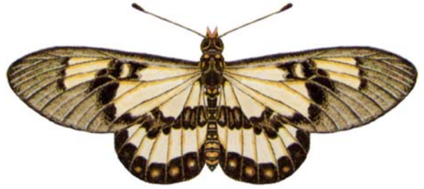
属名 Acraea 種小名 satis 英名 East Coat Acraea 和名 トウガンホソチョウ 分布 ナタール、モザンビーク、東ローデシアの沿岸 開長 66mm ♀