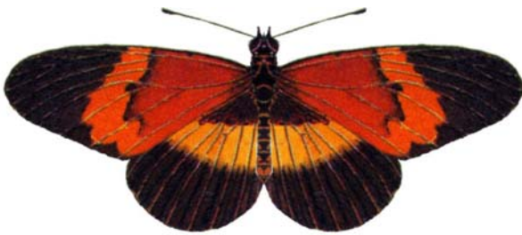
属名 Bematistes 種小名 quadricolor 英名 Four Colored wandere 和名 ヨンシヨクホソチョウ 分布 ケニア、ウガンダ、タンザニア 開長 66mm